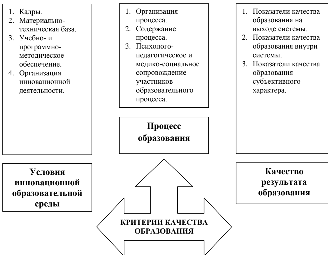
Рис 2. Критерии качества образования.

Авторы предлагают следующий состав групп критериев (см. рис. 2).